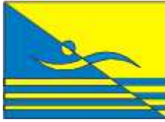
Plivački savez Bosne i Hercegovine